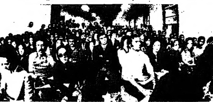
جانب من الجمهور الذي استمع